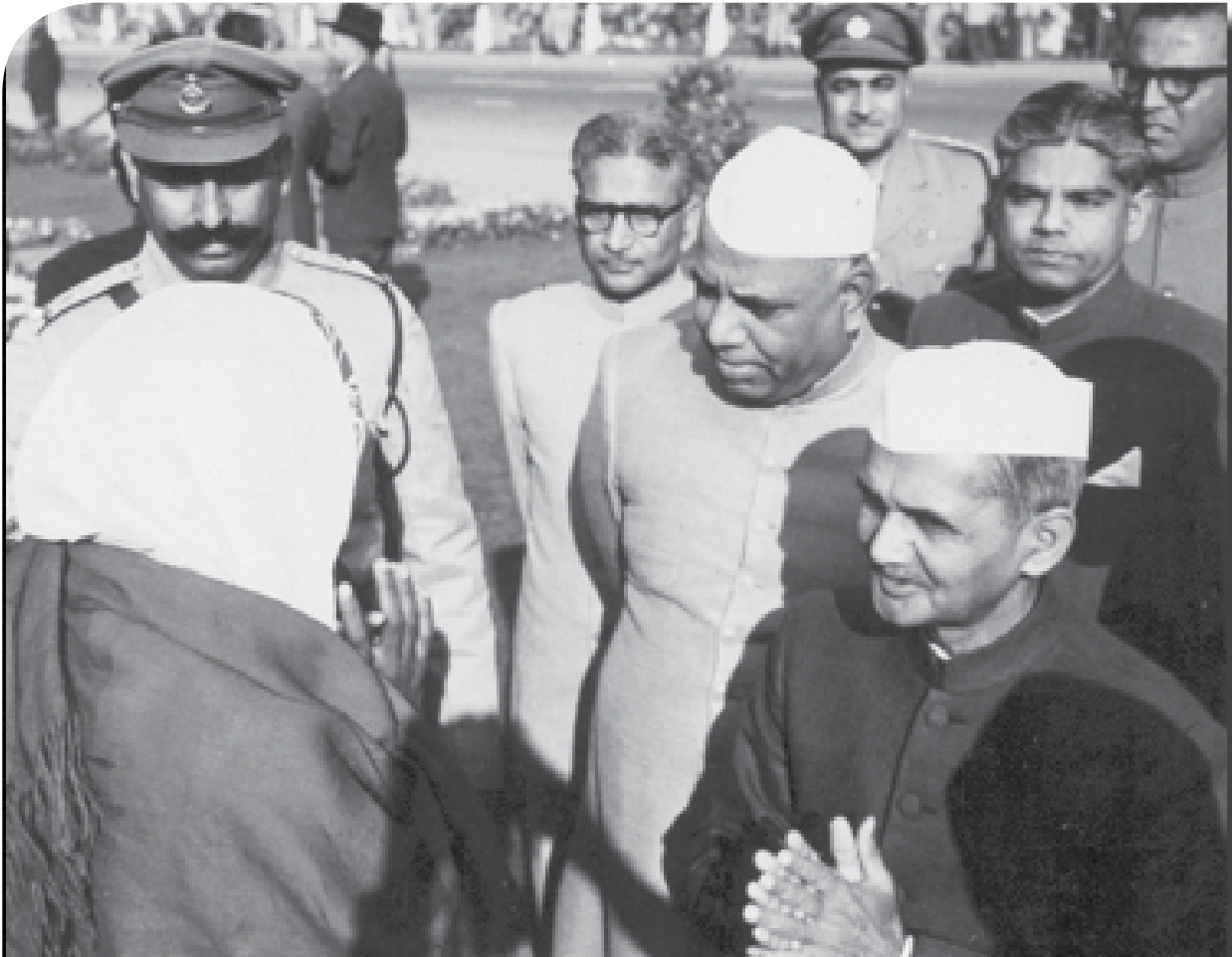
लालबहादूर शास्त्रीजींसोबत.... (१९६६)