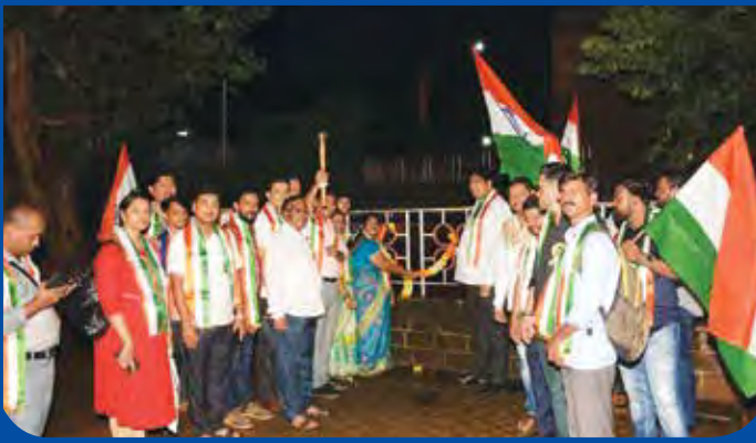
नवमहाराष्ट्र युवा अभियानच्या वतीने स्वातंत्र्य दिनाच्या पुर्व संध्येला आयोजित युवा स्वातंत्र्य ज्योत रॅलीत उपस्थित कार्यकर्ते