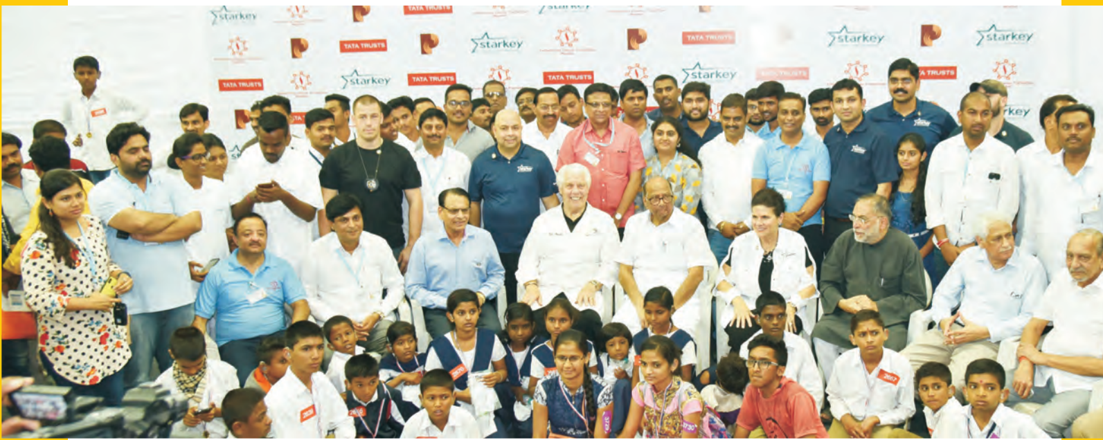
Yashwantrao Chavan Pratishthan, Mumbai