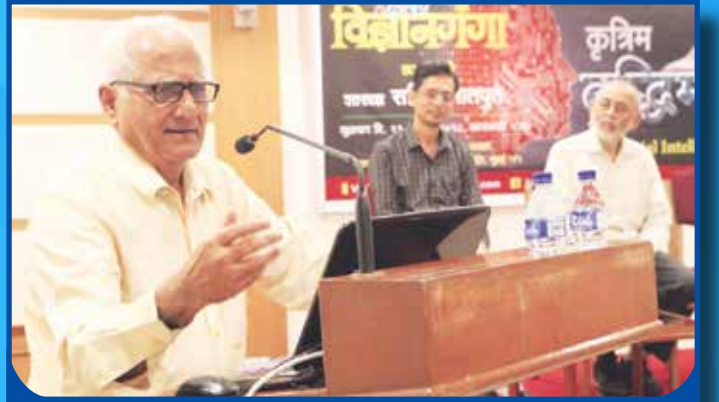
विज्ञानगंगा आयोजित कृत्रिम बुद्धिमत्ता या विषयावर चर्चासत्र