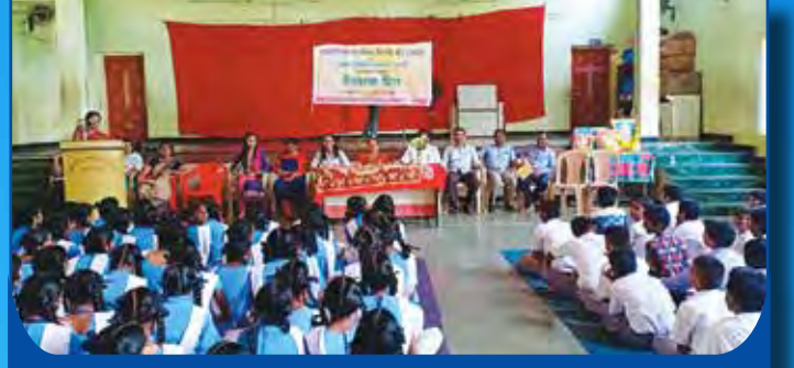
विभागीय केंद्र रत्नागिरी आयोजित सहाद्री शिक्षण संस्था यांच्या सयुक्त विद्यमाने माध्यमिक महिला विद्यालय पाग चिपळुन येथे शिक्षण दिनाचे आयोजन