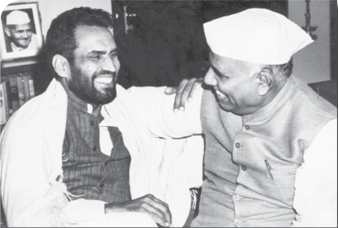
चंद्रशेखर यांचे समवेत.... (वर्ष १९७९)