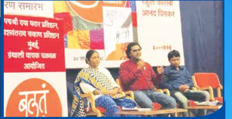
(बलुत)ची चाळीशी या कार्यक्रमात प्रेक्षकांशी संवाद साधताना उपस्थित मान्यवर