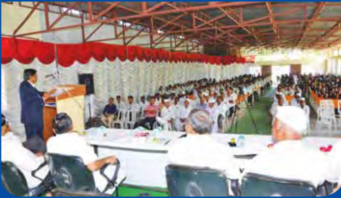
विभागीय केंद्र, अहमदनगर.. शेती कट्टा या उपक्रमा अंतर्गत आयोजित करण्यात आलेले कार्यक्रम