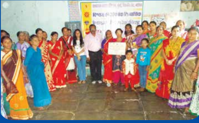
विभागीय केंद्र, नाशिक महिलांसाठी आयोजित पॅनकार्ड शिबीर