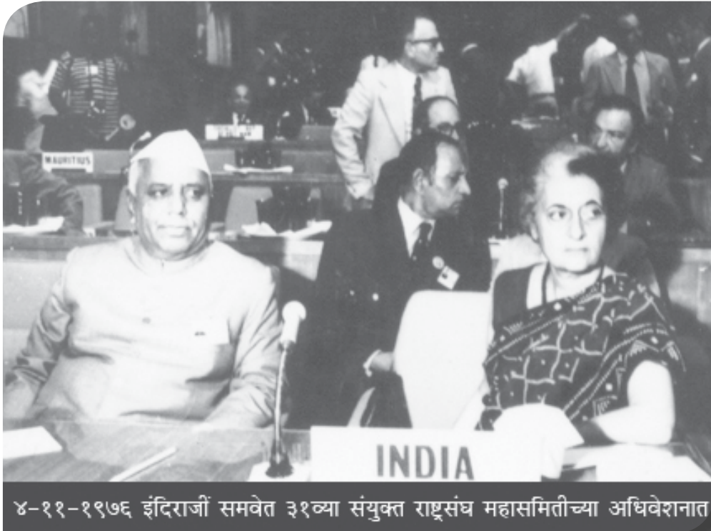
४-११-१९७६ इंदिराजीं समवेत ३१व्या संयुक्त राष्ट्रसंघ महासमितीच्या अधिवेशनात

जास्तीत जास्त वृक्षलागवड करून निसर्गाचा समतोल कसा राखता येईल आणि वृक्ष लागवडीचे महत्त्व जन - मानसात निर्माण होणे यासाठी या कार्यक्रमाचे आयोजन केले होते.