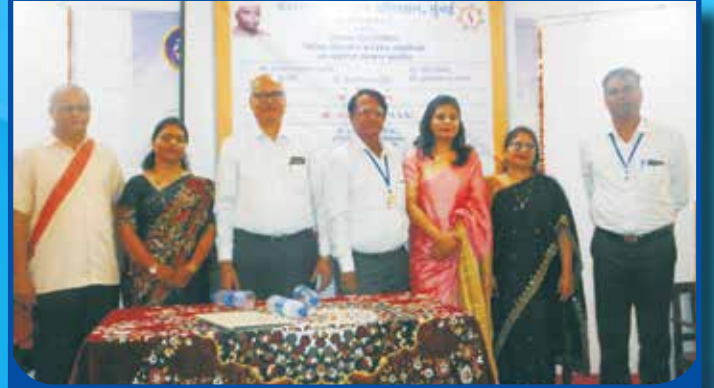
शिक्षक दिनानिमित्त आयोजित कार्यक्रमाचे छायाचित्र सत्कारमूर्ती समवेत केंद्राचे अध्यक्ष व सचिव