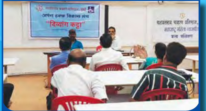
अपंग हक्क विकास मंच 'दिव्यांग कट्टा'