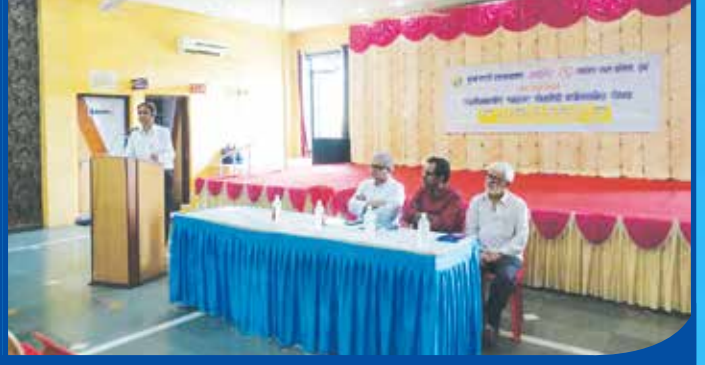
यशवंतराव चव्हाण प्रतिष्ठान, मुंबई मराठी ग्रंथ संग्रहालय यांच्या विद्यमाने महाविद्यालयीन मराठी वाङ्मय मंडळाची (प्रतिनिधी) बैठक दादर येथे पार पडली