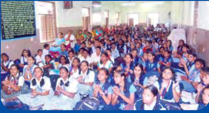
विभागीय केंद्र, पुणे आयोजित श्री. जवाहरलाल नेहरू या विषयावरील निबंध स्पर्धेच्या पारितोषिक वितरण कार्यक्रमास उपस्थित विद्यार्थी व विद्यार्थिनी