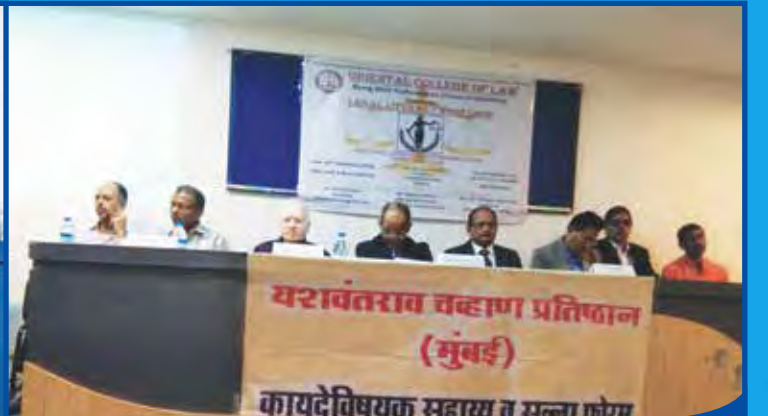
कायदेविषयक सहाय्य व सल्ला केंद्र आयोजित कार्यशाळा