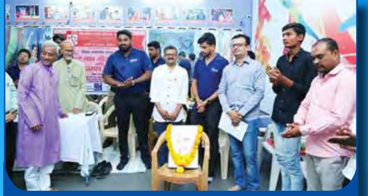
विभागीय केंद्र, अंबेजोगाई येथे कर्णबंधी विद्यार्थ्यांचे नाव नोंदणी, पुर्व तपासणी व मोजमाप शिबीर आयोजित करण्यात आले