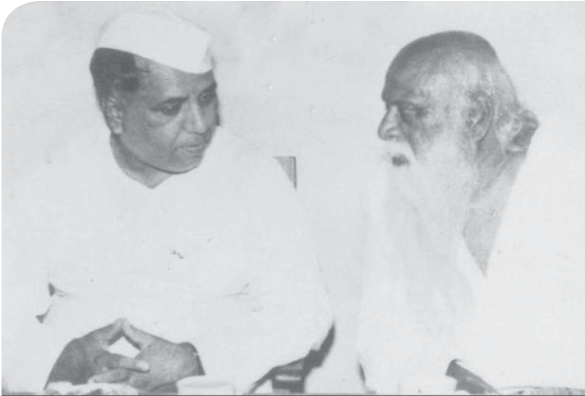
कर्मवीर भाऊराव पाटील यांच्या सोबत..