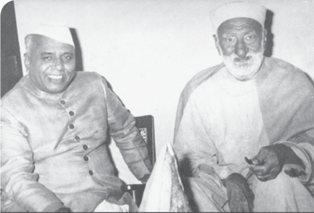
सरहद्द गांधी खान अब्दुल गफारखान यांचे सोबत