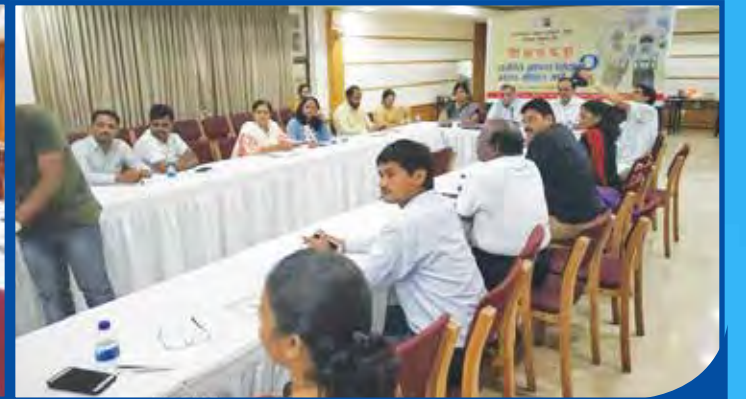
शिक्षण विकास मंच आयोजित (संक्तीचे मोफत शिक्षण खरच मोफत आहे का ? या विषयावर आयोजित शिक्षण कट्टा)