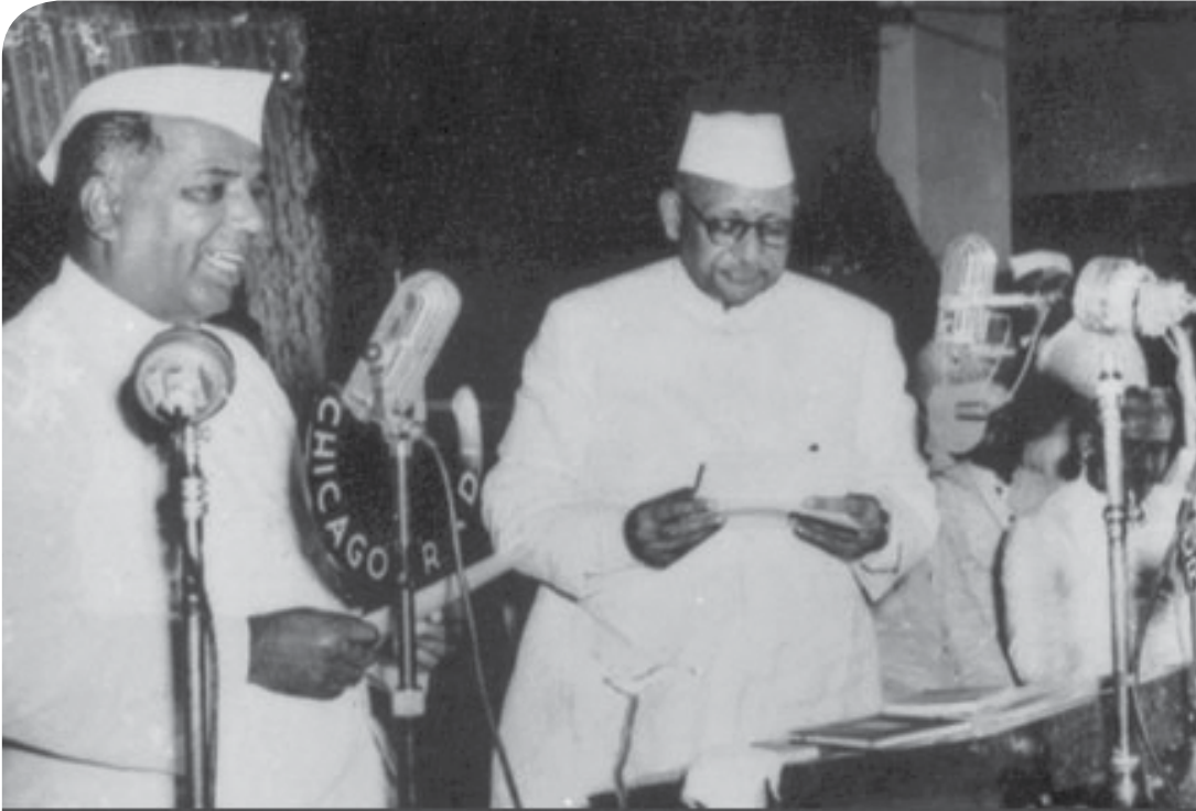
द्विभाषिक राज्याचे मुख्यमंत्री म्हणून रापथ ग्रहण....