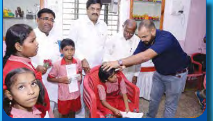
अपंग हक्क विकास मंचच्या वतीने नांदेड येथे मोफत श्रवण यंत्र वाटप पूर्व तपासणी शिबीर आयोजित करण्यात आले होते यावेळी उपस्थित मान्यवर