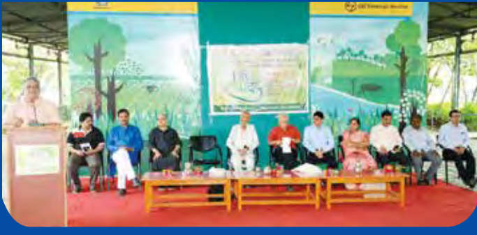
विभागीय केंद्र, अंबाजोगाई यांच्या वतीने आयोजित सिट्टा संवाद कार्यक्रमात उपस्थित मान्यवर