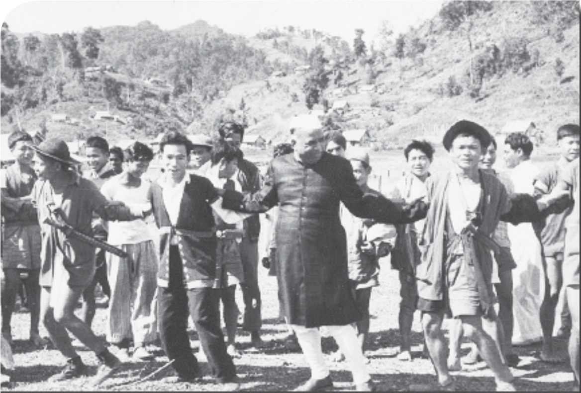
लडाख येथील ग्रामस्थांसमवेत लोकसंगीताच्या तालावर.. (१९६१)