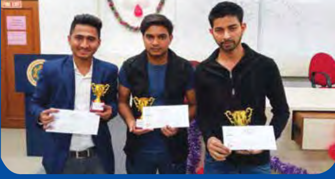
यशवंतराव चव्हाण प्रतिष्ठान, मुंबई माहिती व तंत्रज्ञान प्रबोधिनी प्रशिक्षण वर्गातील सर्वोत्कृष्ट विद्यार्थी